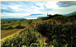
汪楠喬 Wang Nam Khiao

汪楠喬位於昶叻府，離曼谷大約200公里，車程約2-3小時，是一個空氣清新的地方，被聯合國教科文組織評選為世界空氣清新度第7名，有很多山與瀑布以及各種水果。前往汪楠喬的方式，可從曼谷開車經Nakhon Nayok、Prachin Buri、轉達304號公路；或者從曼谷乘火車經Mitrapab-Korat公路，再轉達3號(Akhaoyai) Pak Chong，即可抵達。